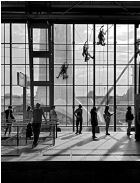
© Barbara Wolff | Metropolis | La Collection Regard @ Goethe-Institut Bordeaux

Der gemeinnützige Verein ParisBerlin>fotogroup, gegründet von der Kuratorin Christel Boget, ist eine Plattform, die seit 20 Jahren in der Förderung von zeitgenössischer Fotografie und der deutsch-französischen sowie europäischen Fotografie-Szene aktiv ist. Seit 2001 hat sich der Verein ParisBerlin>fotogroup mit Sitz in Frankreich und Deutschland eine Expertise in der Organisation von Ausstellungen und Veranstaltungen erarbeitet. Er hat eine Reihe von Fotografen und Institutionen mobilisiert, um ihren Bestand, aber auch spezifische Kreationen zusammenzuführen, um bestimmte Themen zu erarbeiten. Die künstlerische Arbeit der Fotograf*innen, die je nach Thema ausgewählt werden, werden in