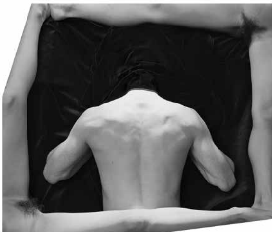
Tono Stano, Man in a Frame, 1991 © the artist, Courtesy the artist CHAUSSEE 36

FOTOHAUS | PARISBERLIN est un concept d'expositions créé en 2015 par ParisBerlin>fotogroup qui met en avant la scène photographique franco-allemande, tout en restant ouvert à d'autres regards. Cette démarche collaborative entre des partenaires français et allemands a pour but de fédérer et de créer un espace d'échanges et de synergies entre les institutions, les photographes, les galeries, les collectionneurs, les agences et les éditeurs. Parallèlement aux expositions, FOTOHAUS propose une programmation de films documentaires et photographiques ainsi que d'événements.