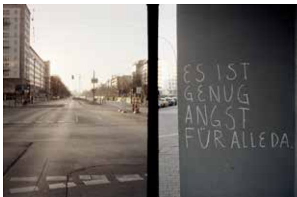
© Chine / Torsten Schumann, Bordeaux / Alexandre Dupeyron, Berlin / Holger Biermann

Commissaires d'exposition : Christel Boget, Eva Gravat Exposition soutenue par : Buergerfondscitoyen, Freundeskreis Willy-Brandt-Haus Berlin, Institut français Berlin, Total Germany, WhiteWall