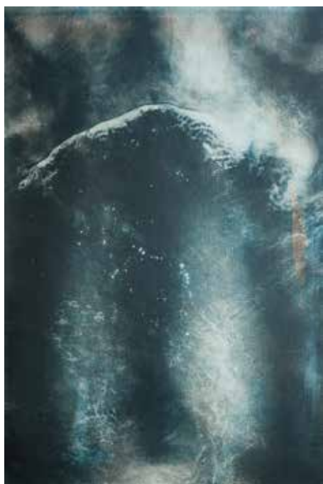
© Alexandre Dupeyron, Monade #12, série DYSNOMIA, 2022. Pièce unique – 40x60cm, tirage multi-couches à la gomme bichromatée polychrome sur papier pur coton.

Comment ne pas soumettre à son regard celui ou celle qu'on prend en photo ? Il me semble que c'est exactement la question que se posent les artistes réunis dans cette exposition. Dans la traduction anglaise de L'Être et le Néant , le concept d'apparence était d'ailleurs traduit par the look , lié plus étroitement qu'en français à la mode et à ce qu'on appelle aujourd'hui le male gaze , ce regard qui pèse en particulier sur le deuxième sexe et que Beauvoir a pensé en pionnière. Sartre, le compagnon de Beauvoir, est un philosophe optimiste, qui nous pousse à inventer notre propre récit et notre propre projet : selon lui, nous portons l'entière responsabilité du déchiffrement de ce qui nous arrive. Mais que se passe-t-il quand on est l'objet d'une photo ? La photographie est un media paradoxal qui peut renforcer les clichés (le mot est né avec la photo) mais qui est aussi capable de nous en libérer.