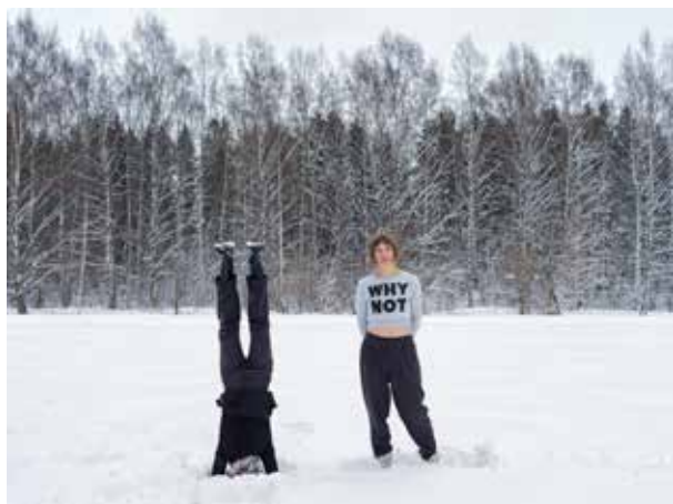
Les soeurs tableau - Das Schloss (Le Château) © Sara Imloul Why Not © Elina Brotherus

Elle expérimente également la vidéo et l'installation à partir de 2013 avec le projet T.R.E.S.E.D. Sara Imloul a reçu le prix Levallois en 2019. Elle a publié deux monographies aux Éditions Filigranes : Passages , en 2022 et Das Schloss , en 2014.