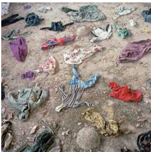
Aidone, Sicily, Italy, September 2017 Catania, Sicily, Italy, August 2017 Abandoned Swimming Pool Complex, Lampedusa, Sicily, Italy, May 2015

La Deutsche Börse Photography Foundation, fondation à but non lucratif, soutient les jeunes artistes qui s'expriment dans le domaine de la photographie par le biais de prix, de subventions et d'expositions, souvent en coopération avec d'autres institutions. Depuis 2017, la Fondation finance le programme Foam Talent, qui est accueilli par le Fotografiemuseum Amsterdam Foam et honore 20 jeunes artistes chaque année. Une partie de cette collaboration consiste en l'acquisition d'œuvres sélectionnées par l'un des "Talents" pour la collection de la Art Collection Deutsche Börse. En 2021, la Fondation a ajouté une sélection d'images de la série I Peri N'Tera du Talent Foam Daniel Castro Garcia à sa collection de photographie contemporaine.