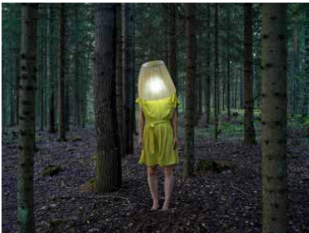
La vague, Passages Artist as Lamp

Il y a des images trop pleines d'histoires, tellement lourdes de récits qu'elles les laissent tranquillement se répandre comme les couleurs s'étalent sur le monde. Ces images coulent et, face à elles, nous sommes pris.e.s dans un flot de mots possibles et de mondes cachés. Il y a une certaine magie à traverser ces images, on vole d'un espace à l'autre sans jamais se cogner car il y a trop de choses à dire, des chants plein les oreilles, des paysages plein le nez.