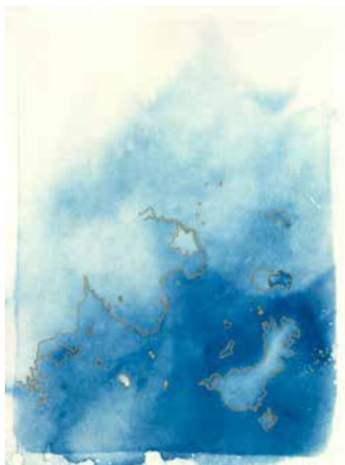
Shifting Roots re-turning around n°8

Dans cette exposition, le collectif d'artistes viennoises fiVe révèle le visible comme l'invisible, bouscule les habitudes ou redessine des frontières inédites. Riche de sa diversité, le groupe présente, en les poussant à l'extrême ou en les traitant avec subtilité, des thèmes actuels : le rôle de la femme, l'urbanisation, les changements climatiques, l'environnement et les migrations.