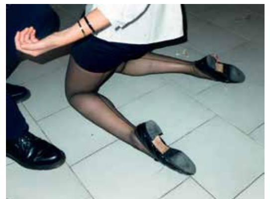
© Bientôt nous danserons | Laurent Laborie

A travers les images d'Holger Biermann, de Laurent Laborie et d'Élie Monferrier, la fête est montrée comme une valeur culturelle et sociale. Ces moments de fête viennent nourrir des besoins et des envies, rappelant justement que la fête est essentielle à nos vies d'êtres sociaux.