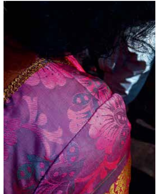
© Bientôt nous danserons | Laurent Laborie

Devenu l'acteur de sa propre vie, le personnage social crée une fiction pour trouver sa place, exprimer ses désirs et apprivoiser les peurs que lui inspire son environnement ( D'ici, ça ne paraît pas si loin , collectif LesAssociés) ou les subir en les exprimant par la violence ou l'exaltation ( American Mirror , Philip Montgomery.)