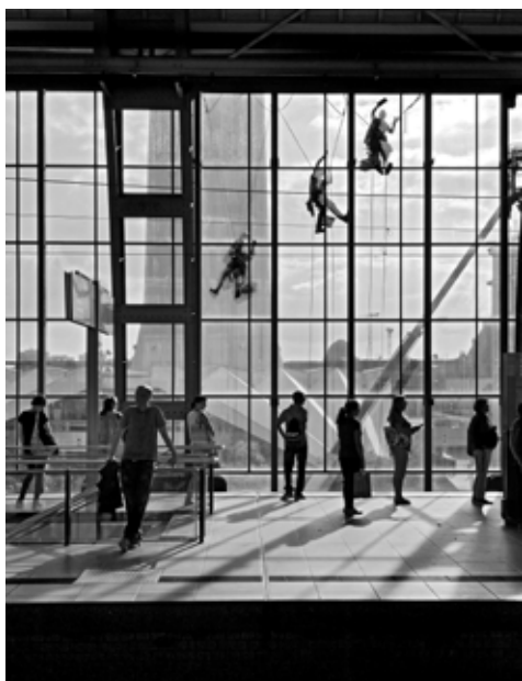
Metropolis | La Collection Regard Présenté au Goethe-Institut Bordeaux