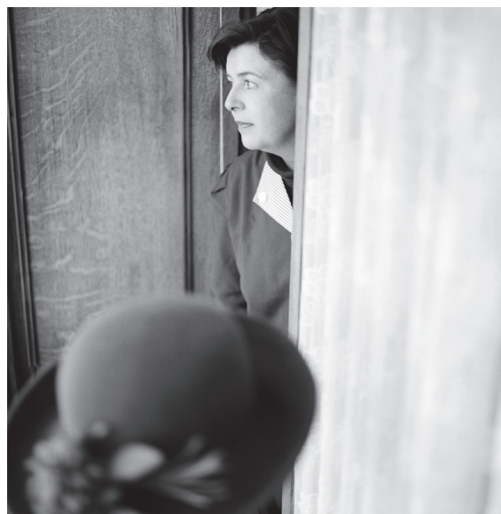
© Elias Holzknecht, Micheldorf Micheldorf Micheldorf Micheldorf Micheldorf , 2021 © Petra Rainer En detail, Hutsalon, Susi

Echoes of the Everyday présente la symbiose artistique de trois photographes qui fusionnent leurs perspectives pour parvenir à une exploration inédite du quotidien, de la banalité, des clichés et de l'ordinaire supposé. Rainer, Stasny et Holzknecht invitent à apprécier les moments réputés ordinaires, à aiguïser notre regard sur ce qui passe justement pour être ordinaire afin d'y découvrir une profonde beauté. Ces récits visuels incitent à réfléchir à la nature complexe de notre environnement et à découvrir un sens dans le laci du quotidien.