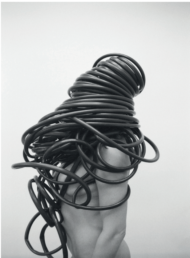
© Soli Kiani, Collectif Advantage Austria

ParisBerlin>fotogroup, association à but non lucratif fondée par Christel Boget, commissaire d'exposition, est une plateforme qui s'engage depuis 20 ans à montrer et à promouvoir la photographie contemporaine tant sur l'axe Paris-Berlin qu'en Europe. Depuis 2014, ParisBerlin>fotogroup a fondé le concept d'exposition FOTOHAUS, décliné en 3 lieux depuis 2022 : Bordeaux, Arles, Berlin.