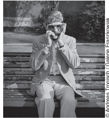
© Andreas Trogisch / Galerie Franzkowiak