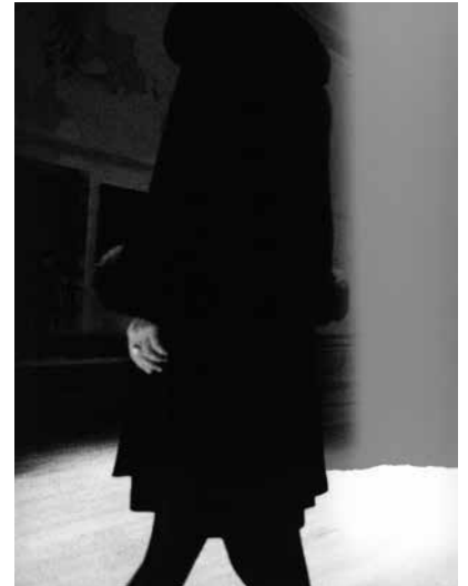
© Amin El Dib | Collection Regard

Die Fotografie ist ein paradoxes Medium, das Klischees verstärken kann (das Wort wurde mit der Fotografie geboren), aber auch in der Lage ist, uns von ihnen zu befreien. Die Fotografinnen und Fotografen dieser Ausstellung stellen die idealistische Welt der Definitionen und die Täuschungen des Scheins in Frage, indem sie in die Falten einer fließenden, instabilen und nicht-binären Welt schlüpfen.