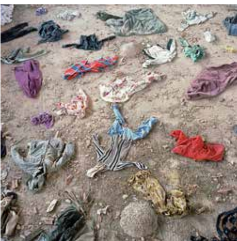
Aidone, Sicily, Italy, September 2017 Catania, Sicily, Italy, August 2017 Abandoned Swimming Pool Complex, Lampedusa, Sicily, Italy, May 2015