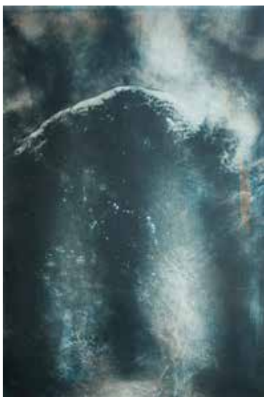
© Alexandre Dupeyron, Monade #12, série DYSNOMIA, 2022. Unikat – 40X60cm, mehrschichtiger mehrfarbiger Gummibichromatverfahren auf reines Baumwollpapier.

Wie kann man denjenigen, den man fotografiert, nicht seinem Blick unterwerfen? Mir scheint, dass sich die in dieser Ausstellung versammelten Künstlerinnen und Künstler genau diese Frage stellen. In der englischen Übersetzung von L'Être et le Néant wurde das Konzept des Aussehens übrigens mit the look übersetzt, enger als im Französischen verbunden mit Mode und dem, was man heute als male gaze bezeichnet, der Blick, der insbesondere auf dem deuxième sexe (in der deutschen Übersetzung Das andere Geschlecht) lastet und den Beauvoir als Pionierin durchdacht hat. Beauvoirs Lebensgefährte Sartre ist ein optimistischer Philosoph, der uns dazu drängt, unsere eigene Erzählung und unser eigenes Projekt zu erfinden: Seiner Meinung nach tragen wir die volle Verantwortung für die Entschlüsselung dessen, was uns widerfährt. Aber was passiert, wenn man selbst zum Gegenstand eines Fotos wird?