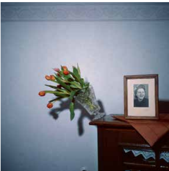
© Alex Bex - Memories of Dust