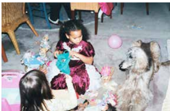
© Verdiana Albano, i ain't from no east coast , 2024

Wenn man immer wieder gefragt wird, woher man kommt, führt es dazu genauer darüber nachzudenken.