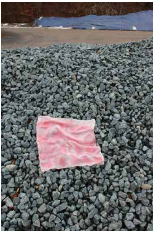
© Antonia Elsa Karnetzky / HfG Offenbach

FOTOHAUS ist ein Ausstellungskonzept, das 2014 von der ParisBerlin>fotogroup ins Leben gerufen wurde und die deutsch-französische Fotoszene in den Vordergrund stellt, indem es sich auf gekreuzte Blicke rund um ein gemeinsames Thema konzentriert. FOTOHAUS soll die Grenzen für einen Dialog der Kulturen und Gebiete öffnen. Diese Zusammenarbeit zwischen den Partnern hat zum Ziel, die Akteure der deutschen und französischen Fotografie zusammenzubringen und einen Raum für Austausch und Synergien zwischen Institutionen, Fotografen, Galerien, Sammlern, Agenturen und Verlegern zu schaffen..