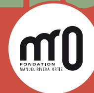
FOTO HAUS 2023 ARLES

LES RENCONTRES DE LA PHOTOGRAPHIE | ARLES ASSOCIÉ