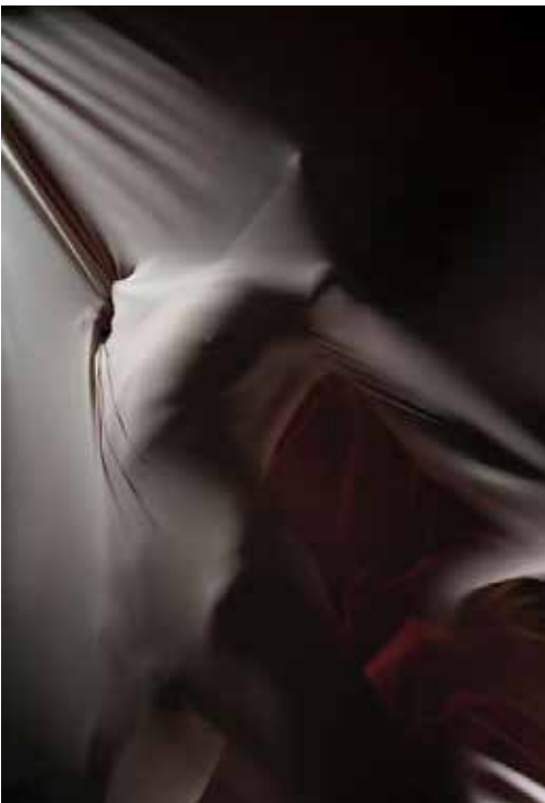
Natalia Dymkowski, Untitled, 2020 © Natalia Dymkowski, Courtesy the artist

Anlässlich des Projekts Persona von FOTOHAUS, präsentiert CHAUSSEE 36 eine Auswahl von Werken der Gruppenausstellung EROS & PHOTOGRAPHY - Part I: Behind Desire , die sich zum Ziel gesetzt hat, die Erotik, die Kunst des Begehrens, vorzustellen und ihre verschiedenen Facetten in der künstlerischen Fotografie zu untersuchen.