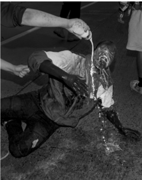
Untitled, Minneapolis, Minnesota, May 2020