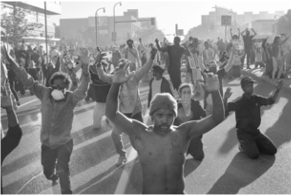
Hiawatha Bridge, Minneapolis, Minnesota, May 2020